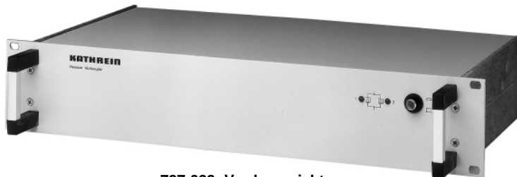
727 622 Vorderansicht

Die HF-Signale werden am Eingang des Trennverstärkers durch einen redundant aufgebauten, rauscharmen Verstärker verstärkt. So bleibt der Trennverstärker auch bei Ausfall eines der parallel geschalteten Verstärkermodule einsatzfähig, wobei die Verstärkung um ungefähr 6 dB verringert wird. Jedes Verstärkermodul hat eine eigene Spannungsversorgung. Diese sind so ausgelegt, dass sie den gleichzeitigen Betrieb sowohl mit Wechselspannung (230 V) als auch mit Gleichspannung (+11 bis +48 V DC) ermöglichen.