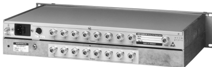
727 622 Rückansicht