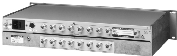
727 622 rear view