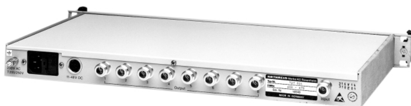
727 621 rear view